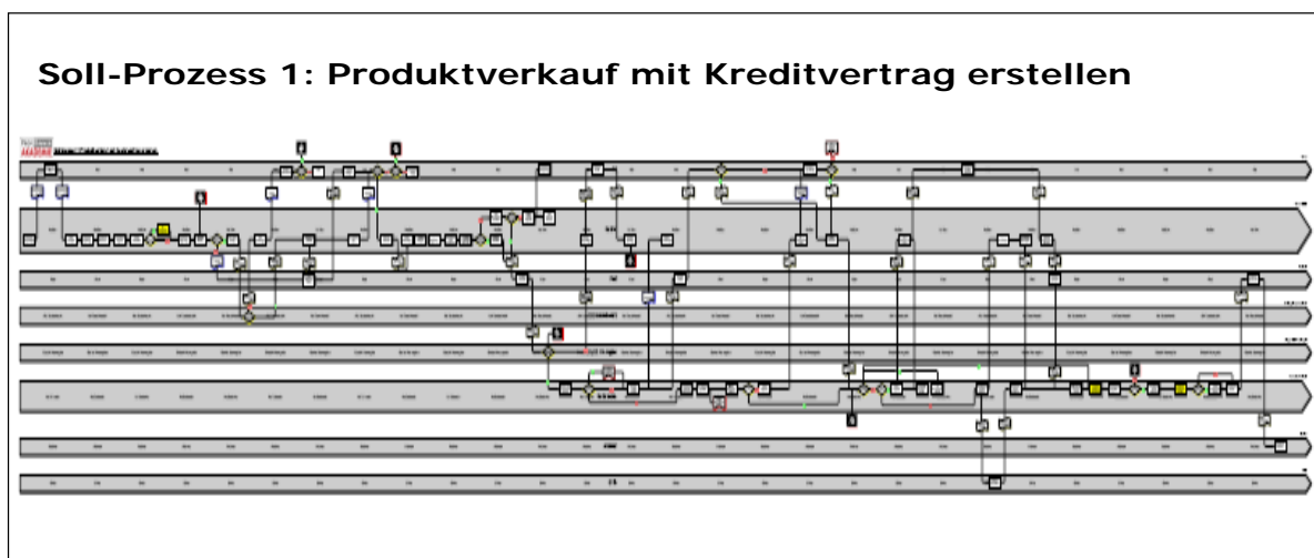
Abb. 2 Produktverkauf mit Erstellung des Kreditvertrags (SOLL)

In Abbildung 2 ist das Ergebnis der am zweiten Tag stattfindenden Sollprozessmodellierung dargestellt. Gemeinsam mit den Workshopteilnehmern wird geprüft, wie sich der Ist-Prozess vereinfachen und beschleunigen lässt. Unter den Gesichtspunkten der Funktionsintegration, Schnittstellenreduzierung oder Auslagerung lassen sich Ansatzpunkte zur Prozessoptimierung finden. Über die Transparenz der Prozessdarstellung wird den Beteiligten klar, an welcher Stelle Prozessvereinfachungen mit welchen Auswirkungen für die Beteiligten entstehen.