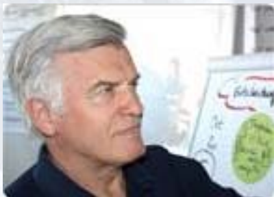
Robert Hierl Leadership-Services GmbH 92272 Freudenberg www.Leadership-Services.com